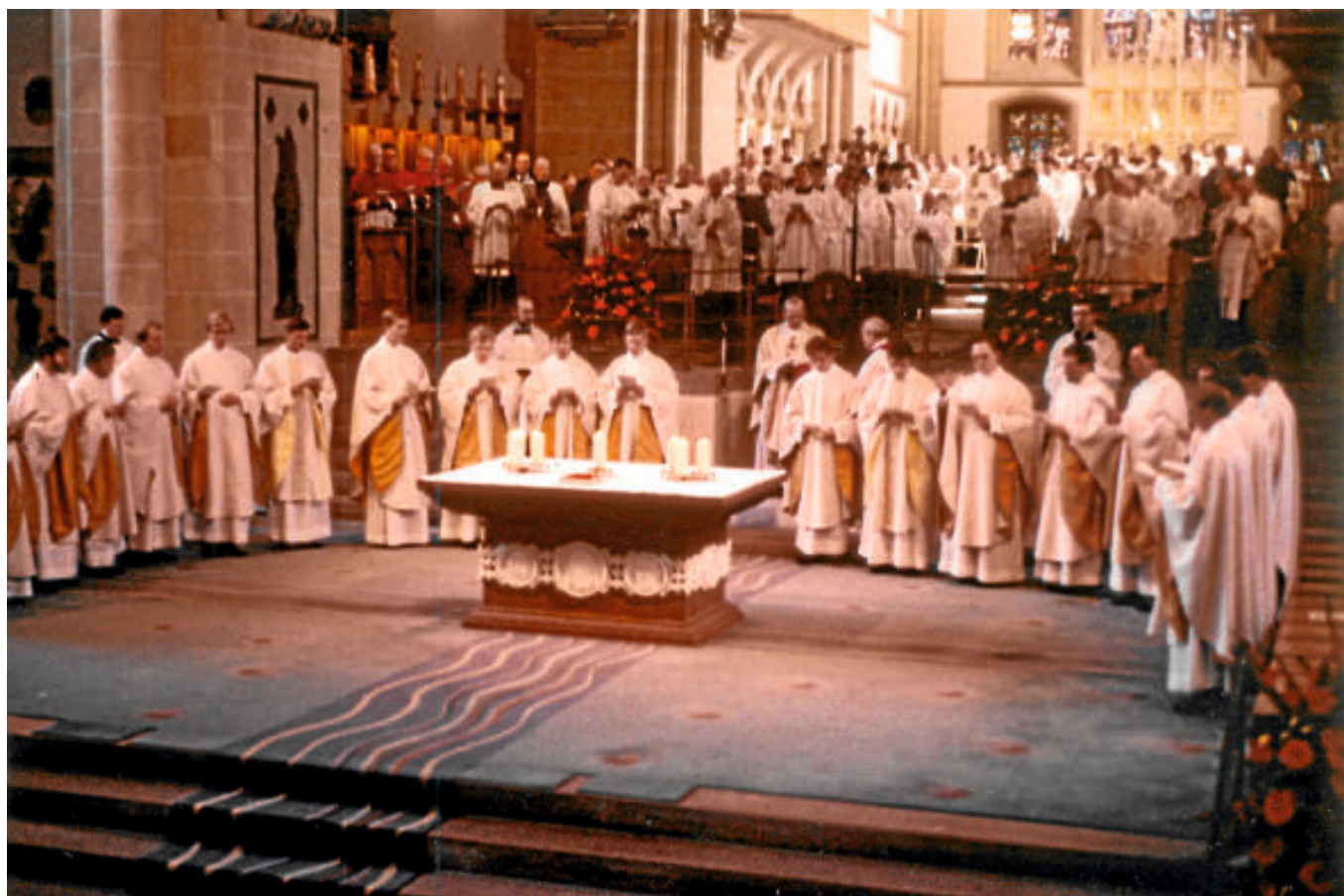
Priesterweihe am 17.05.1986 in Paderborn